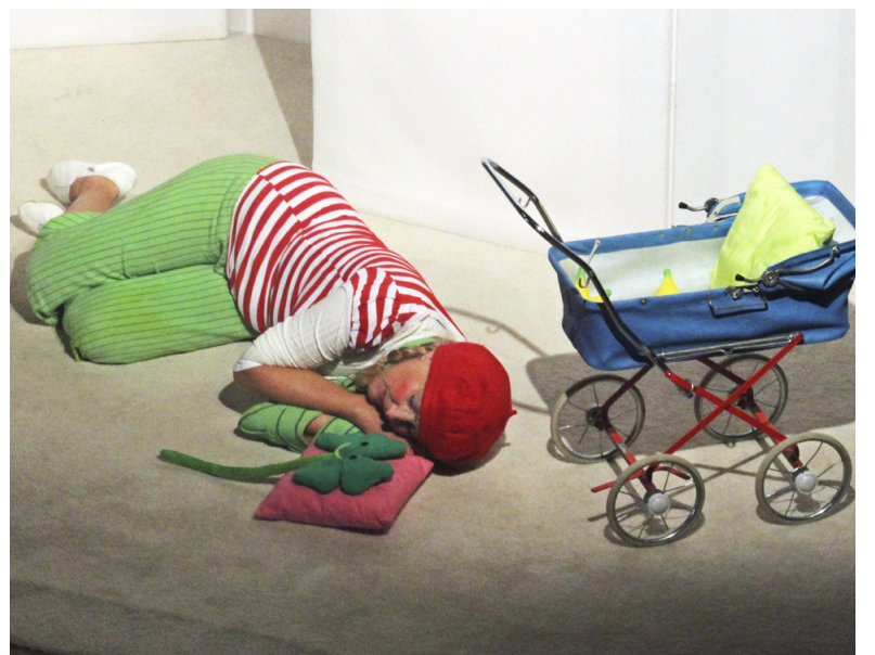
NOLLAN. Sovstund på vandringen.