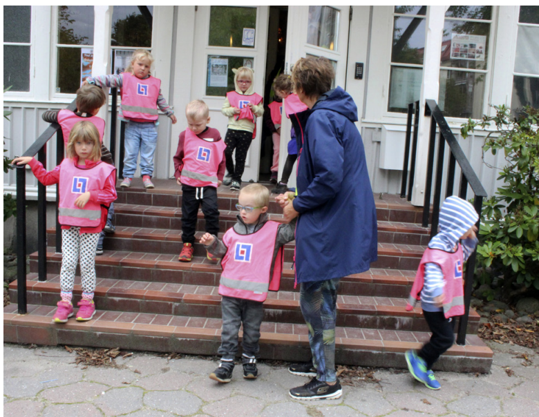
MÅNGA. Rossö förskola på väg hem.