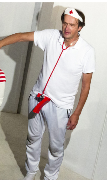
och Nollan får sju kakor.